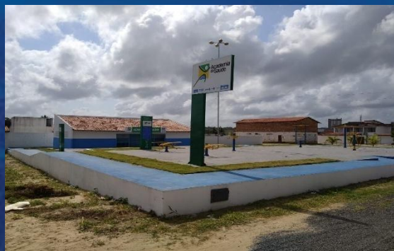
Academia da Saúde