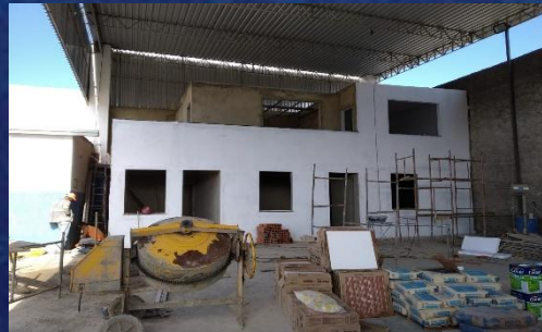
Base do SAMU