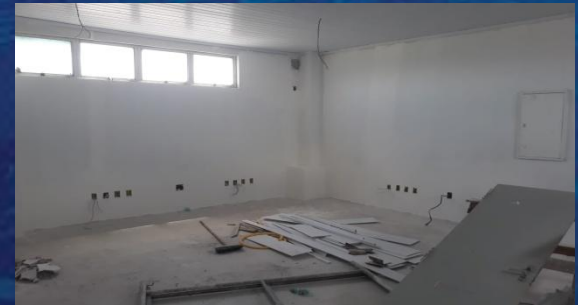
Reforma da VISAU