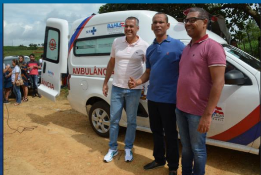
Entrega ambulância Boa União