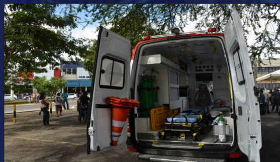
Entrega Ambulância SAMU