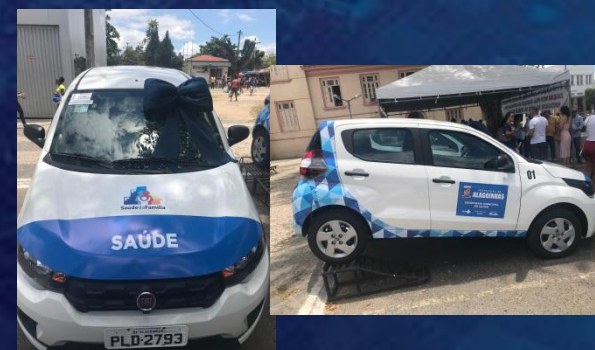
Entrega de dois veículos para AB