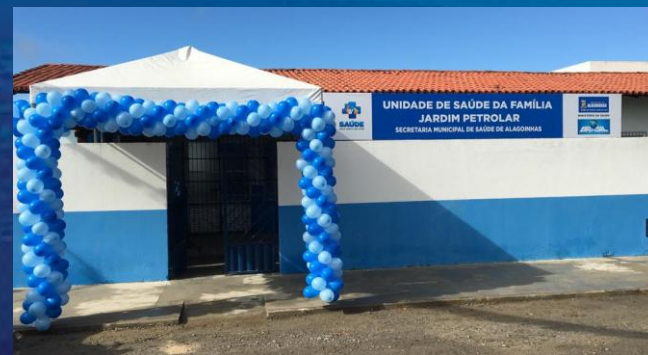
Reforma Jardim Petrolar